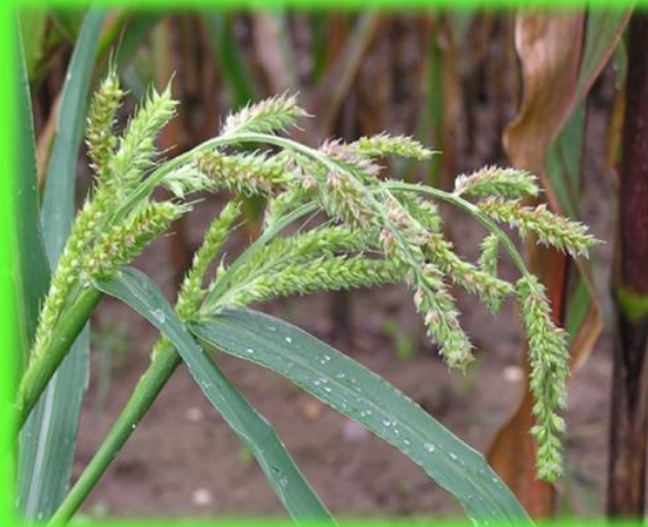
මව්ව Echinochloa crus-galli

* කොළපාළම දිවීම Magnaporthe grisea සඳහා ආවේණික ධාරකයෙකි