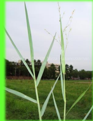
අවමරා Panicum repens

* කොළපාළම දිවීම Magnaporthe grisea සඳහා ආවේණික ධාරකයෙකි