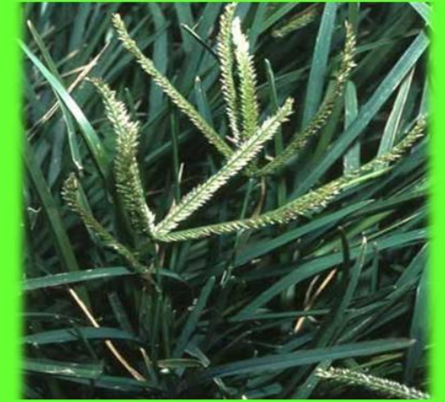
මැලුණු Eleusine indica

* කොළපාළම දිවීම Magnaporthe grisea සඳහා ආවේණික ධාරකයෙකි