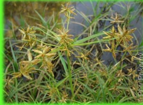
කලාඳුරු Cyperus rotundus

* කොළපාළම දිවීම Magnaporthe grisea සඳහා ආවේණික ධාරකයෙකි • කැබ්ට්ටිකානු කොළ අංශ මාරු Xanthomonas oryzae සඳහා ආවේණික ධාරකයෙකි