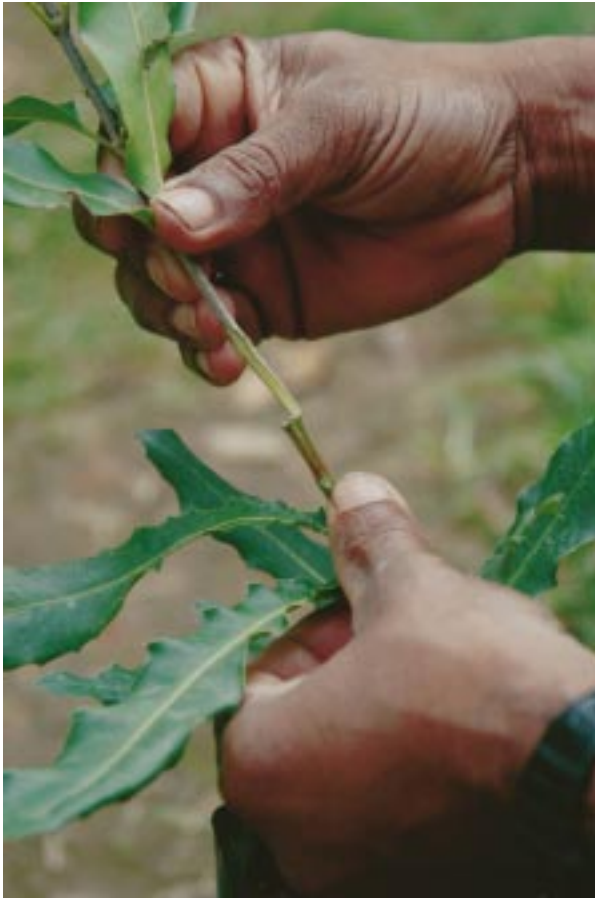
කුසඳ්ඳු බද්ධය සිදු කරන ආකාරය

බද්ධ පැලයකින් වසර 6 කදී පමණ අස්වැන්න නෙලා ගත හැකිය. මේ සඳහා සාර්ථකම ප්‍රචාරණ ක්‍රමය වනුයේ කුසඳ්ඳු බද්ධයයි.