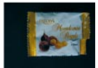
මැකඩමියා යෙදූ විවිධ නිෂ්පාදන

ප්‍රභේද සංවර්ධනය: ඉන්ද්‍රාණී මැදගොඩ මිය, උද්‍යාන තෝග පර්යේෂණ හා සංවර්ධන ආයතනය, ගන්නොරුව