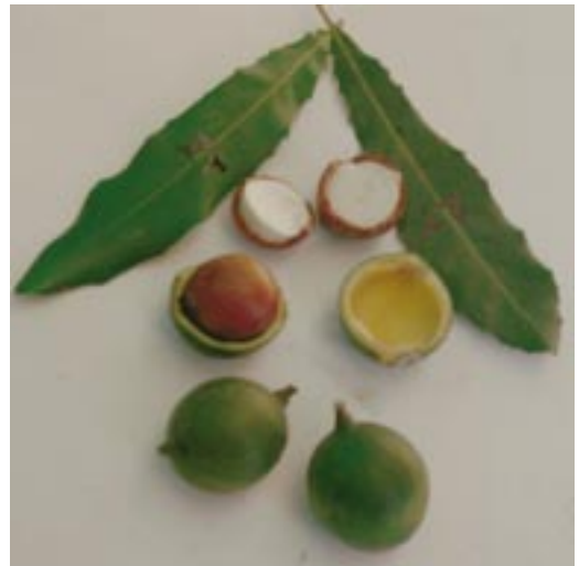
මැකඩමියා එල හා මදය

ජල ප්‍රතිශතය සහ මේද අම්ල ප්‍රමාණය වැඩි වෙනසක් නොමැති වුවත් මේද ප්‍රතිශතය සලකා බැලූ කල 778 සහ 800 ප්‍රභේද අනෙකුත් ප්‍රභේදවලට වඩා වැඩි අගයක් ගනී. මෙහි ගුණාත්මය රඳා පවතින්නේ මේද ප්‍රතිශතය අනුව බැවින් අනෙකුත් ප්‍රභේද හා සංසන්දනය කර බැලීමේදී 778 සහ 800 ප්‍රභේද වඩා සුදුසු බව පෙනුණි. එනිසා මෙම ප්‍රභේද දෙක 2007 වසරේදී ලංකා (778) සහ හර්ෂ (800) යන නම් වලින් කෘෂිකර්ම දෙපාර්තමේන්තුව මගින් නිර්දේශ කර ඇත.