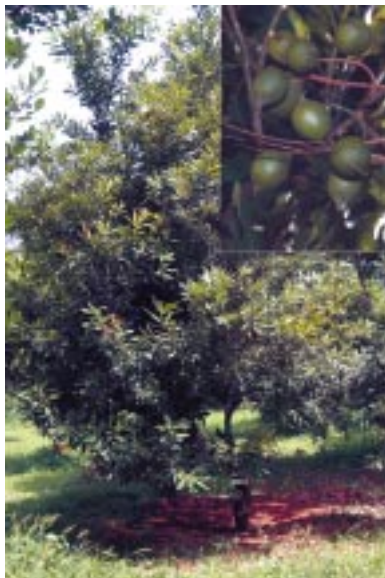
මැකඩමියා ශාකය සහ ඵල

2007 ජූලි මස 4 වන දින පැවැත්වූ කෘෂිකර්ම දෙපාර්තමේන්තු ප්‍රභේද නිර්දේශ කිරීමේ කමිටු රැස්වීමේදී වැල් අල ප්‍රභේද 2ක්, ජමනාරං ප්‍රභේදයක්, පැණි දෙඩම් ප්‍රභේදයක් හා මැකඩමියා ප්‍රභේද 2 ක් නිර්දේශ කරන ලදී.