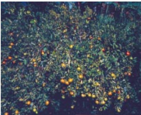
රහංගල ජමනාරං ප්‍රභේදය