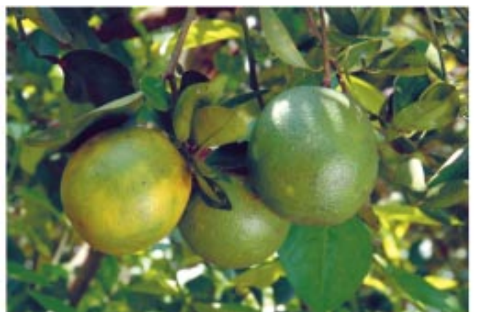
පැණි දෙඩම් MKD ප්‍රභේදය

"අපි වඩමු - රට නගමු" දේශීය ආහාර නිෂ්පාදනය දිරි ගන්වමු