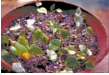
ආසාදිත බීජ පැල