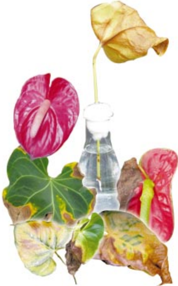
කෘෂිකර්ම දෙපාර්තමේන්තුවේ ප්‍රකාශනයකි