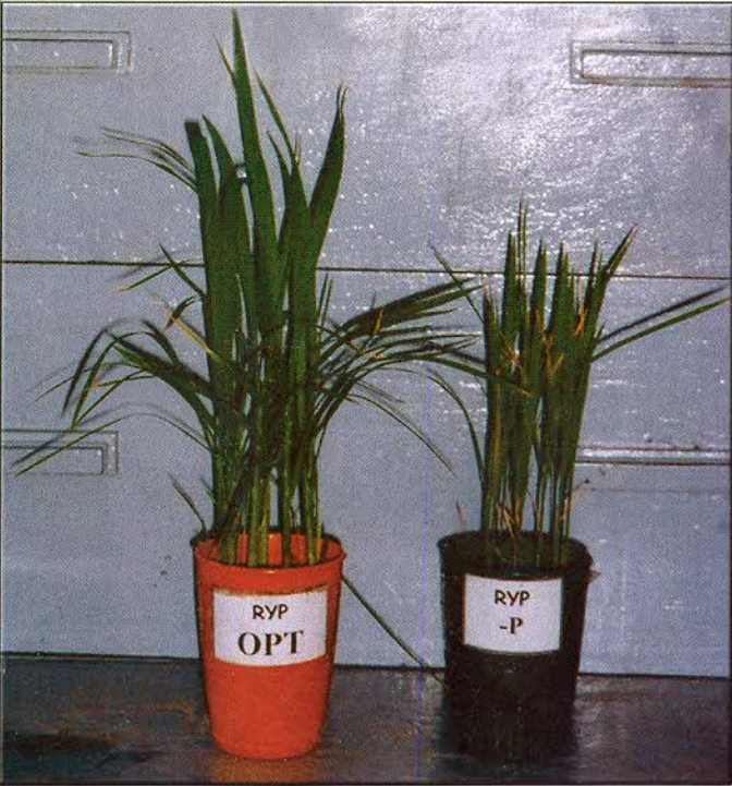
කෘෂිකර්ම දෙපාර්තමේන්තුවේ ප්‍රකාශනයකි