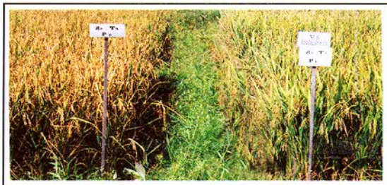
4 වන රූපය : කරල් පිරෙන අවධියේ P උපකාරක ලක්ෂණ

ශාකයේ නිරෝගි වර්ධනය සඳහා පඳුරු දමන අවධියේදී ශාක පත්‍ර වල 0.2 - 0.4% ප්‍රමාණයක් පොස්පරස් තිබිය යුතු අතර මෙම අගය 0.1% වඩා අඩු වූ විට පොස්පරස් උපකාරක ලක්ෂණ පෙන්වයි. එහෙත් මල් පිපෙන අවධියේදී උපකාරක ලක්ෂණ පෙන්වන්නේ පටකවල පොස්පරස් ප්‍රමාණය 0.18% වඩා අඩුවූ විටය. මේනිසා පඳුරු දමන අවධිය වනවිට ශාකයට පොස්පරස් ප්‍රගස්ට මට්ටමින් ලබාදිය යුතුය. මේ සඳහා පසෙහි තිබිය යුතු ප්‍රගස්ට පොස්පරස් ප්‍රමාණය කි. ග්‍රෑම් 1 ට මි. ග්‍රෑම් 12-24 වන අතර පසෙහි ලබාගත හැකි පොස්පරස් අගය පස් කි. ග්‍රෑම් 1 ට මි. ග්‍රෑම් 10 ට වඩා අඩු වූ විට උපකාරක ලක්ෂණ පෙන්වීමට පටන් ගනී.