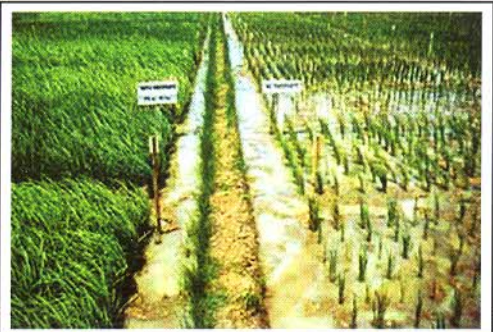
2 වන රූපය : පොස්පරස් යෙදූ හා නොයෙදූ කේතනයක්