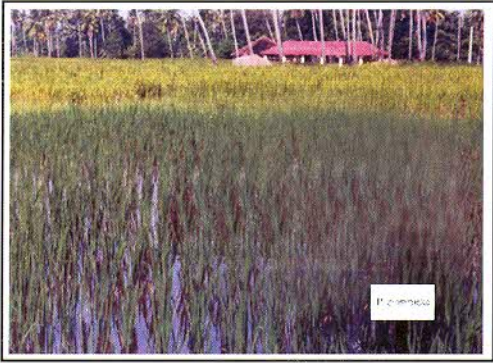
3 වන රූපය : පොස්පරස් නොයෙදූ කේතනයක්