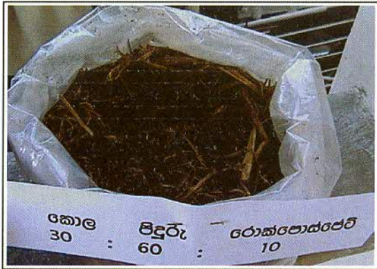
5 රූපය: පොස්පො - කොම්පෝස්ට්

වී වර්ගය, පාංග හා ජල පාලනය, වල් පැළ, කෘමි හා රෝග මර්ධනය ඇතුළු අනෙකුත් වගා පිළිවෙත් අනුගමනය කිරීමෙන් යොදන P පොහොර වල කාර්යක්ෂමතාව වැඩිකර යෙදිය යුතු නිර්දේශිත පොහොර ප්‍රමාණය අඩුකර ගත හැකිය.