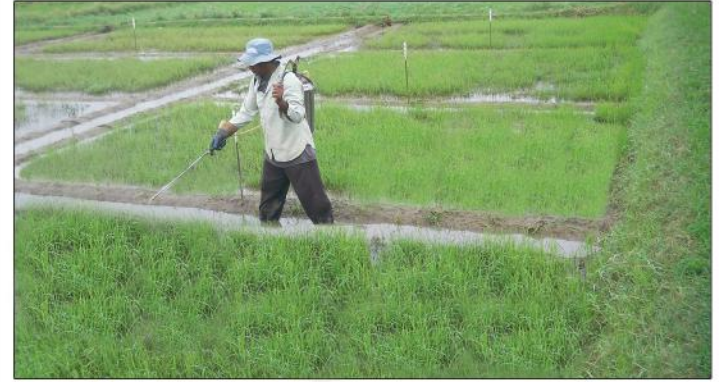
ප්‍රතිකාර කරන ලද මුං බීජ පැළ

මෙහි ඇති පෝෂක නිසා මුල් ඇදීම හා වර්ධනය ඉක්මන් වේ.